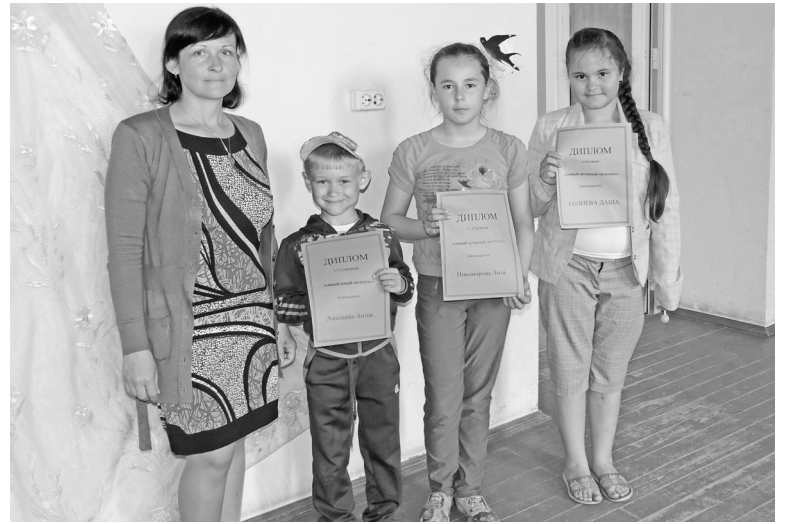
Победители библиовикторины. Верное

В Вертненской библиотеке профессиональный праздник библиотека-